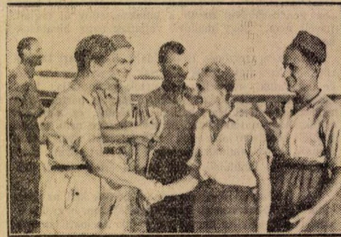
Boldog, ifjú repülők üdvözlük egymást a jólsikerült vizsga után

— A kapott feladatot jól végrehajtotta. Tíz perc harminc másodpercet repült és ezzel elnyerte a „C” vizsgafokot.